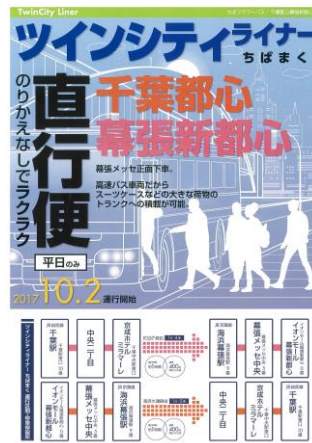
告知チラシデザイン(表・裏)